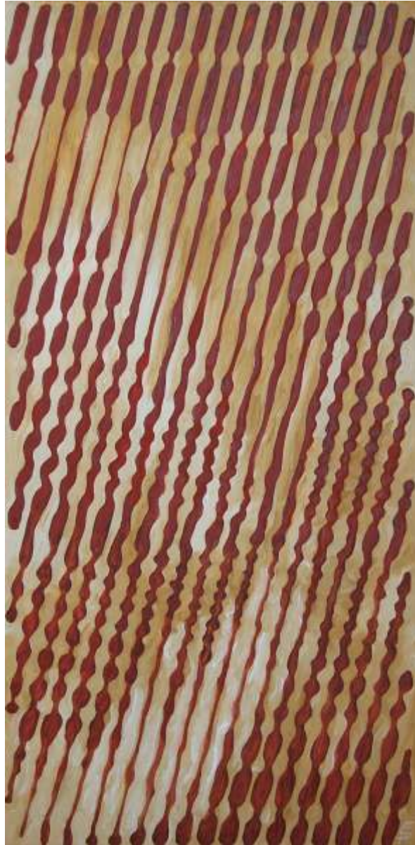
„Leben 2“, Öl auf Leinwand, 50 x 100 cm