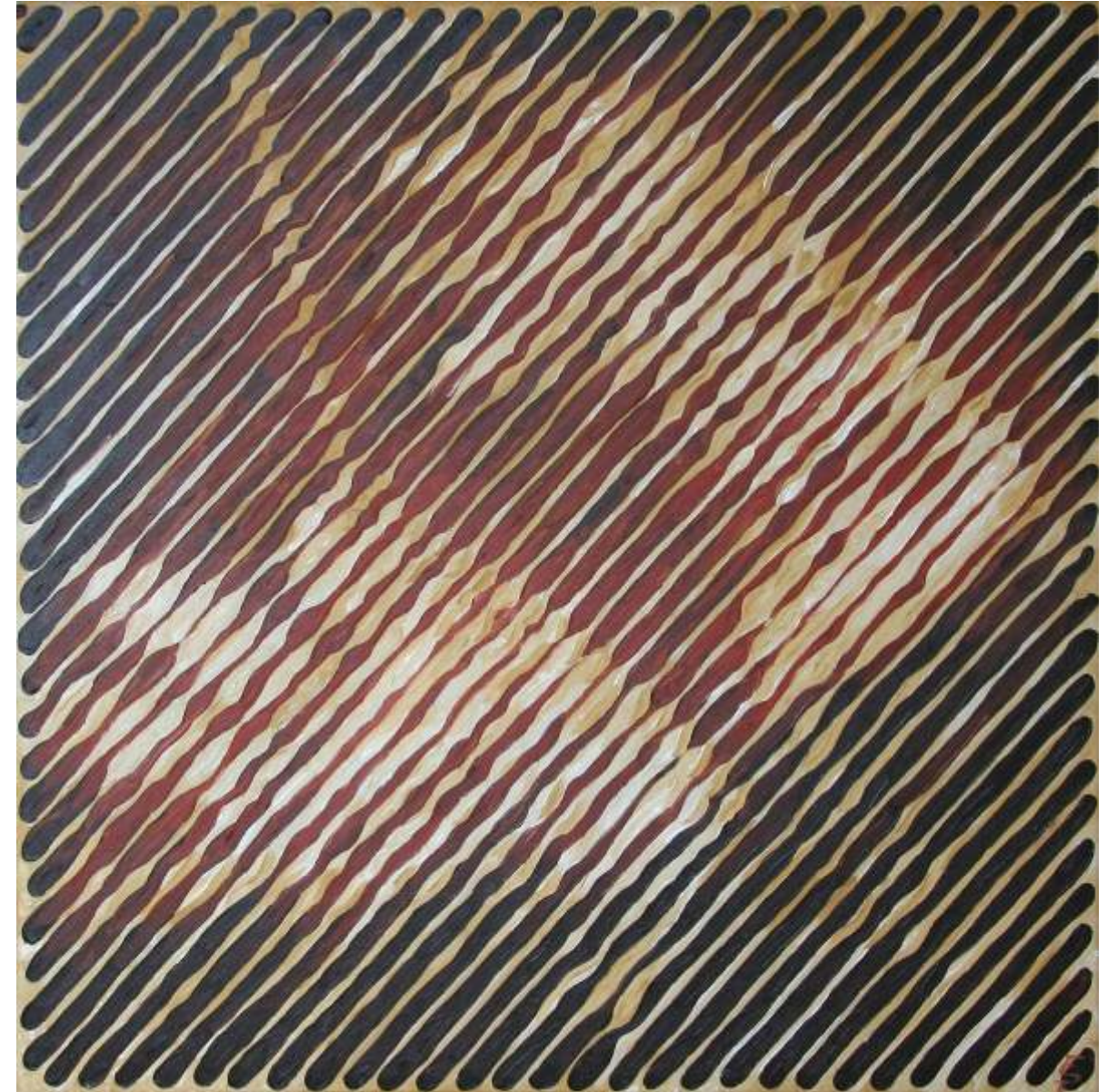
„Können“, Öl auf Leinwand, 80 x 80 cm