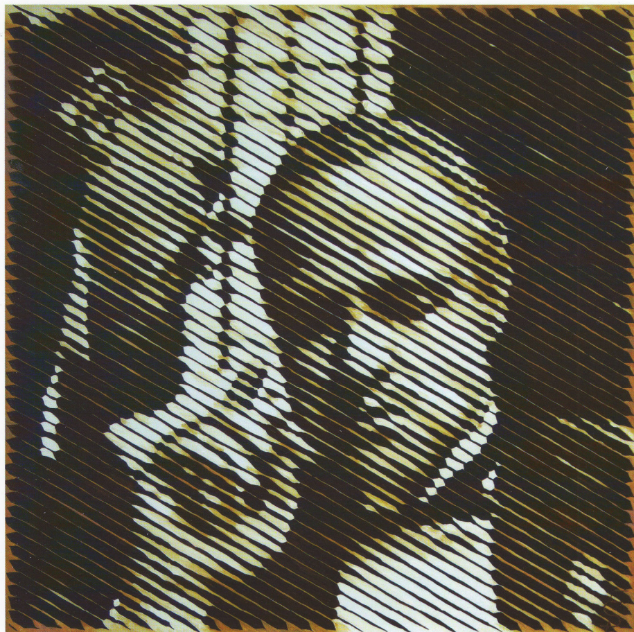
My word is good - [ARTISTA PREMIATA PER LA 1ª BIENNALE D'ARTE EUROPEA - PARIS]

Sembra che Eva M. Paar eserciti il suo occhio alle prospettive e pose, studiando l'atteggiamento e l'effetto della luce. L'Artista accentua la visione della figura femminile descrivendo la sua sensualità. Mentre nell'interpretazione dell'uomo la casualità di sguardi e di gesti viene rafforzata prospettivamente. Eva M. Paar fa dell'osservatore dei suoi lavori lo spettatore della vita della Metropoli, da essere considerata la pittrice della vita moderna.